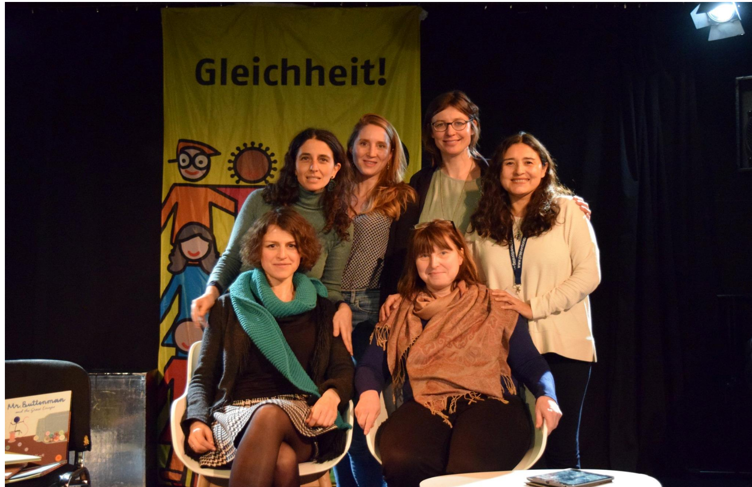
Tag der Muttersprache - Februar 2020 (Pankow)