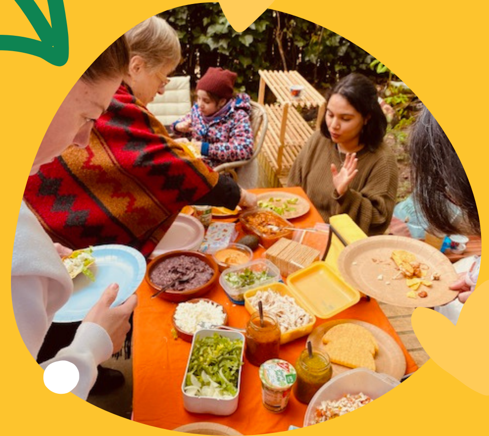
Espacios de Conexión